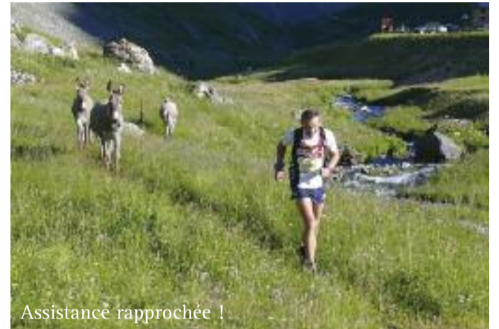
Assistance rapprochée !

L'équipe du « Trail Sky Race » : association « courir en Briançonnais » nous donnera un coup de main, merci à eux.